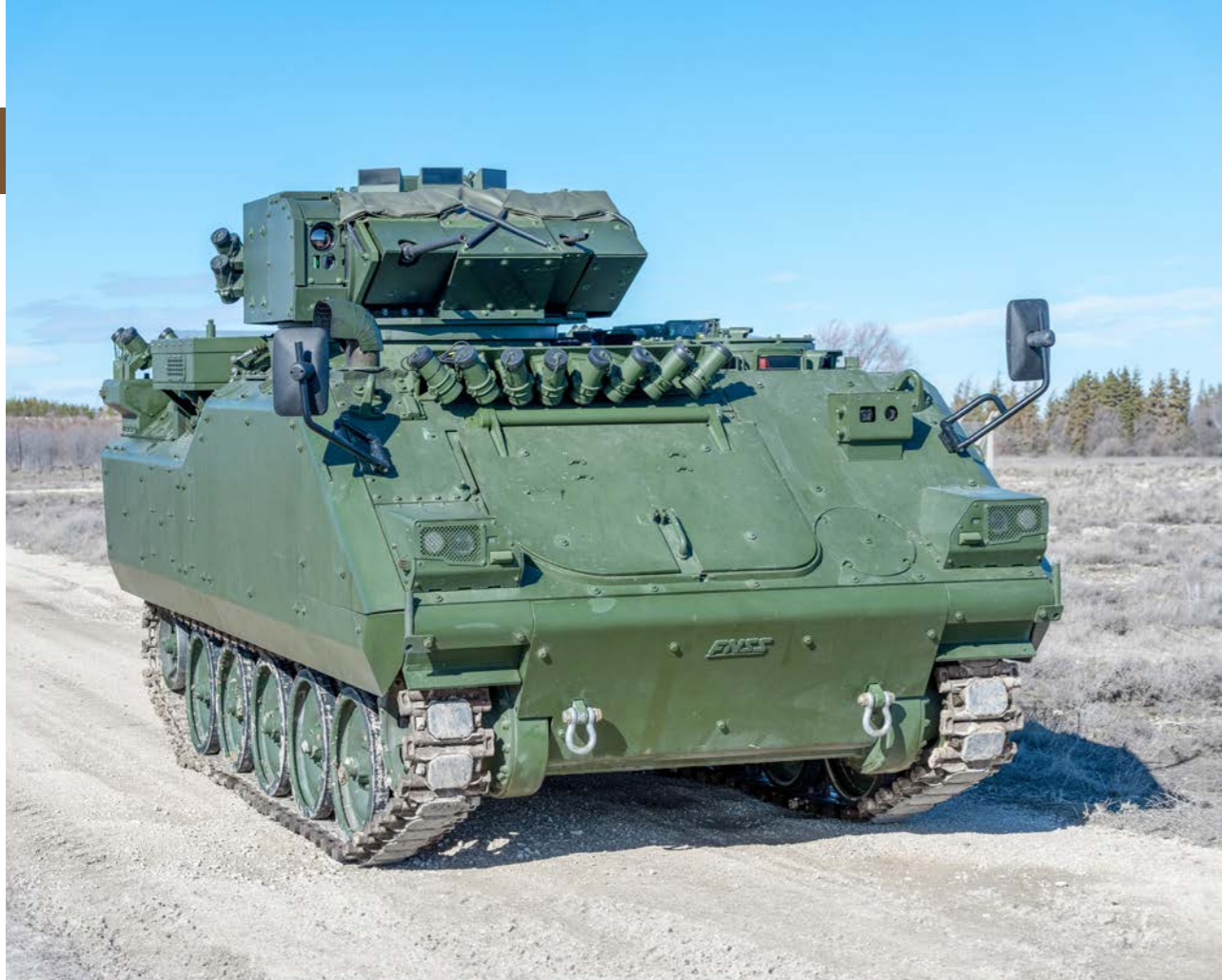
Bilgiler duyuru yapılmaksızın değiştirilebilir.