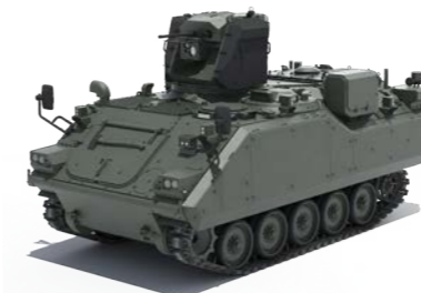
ACV-15T1 CAKA UKK