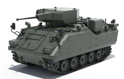
ACV-15T1 SABER UKK